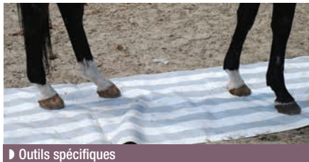
► Outils spécifiques