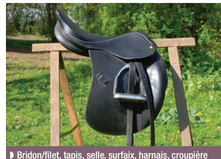
► Bridon/filet, tapis, selle, surfaix, harnais, croupière