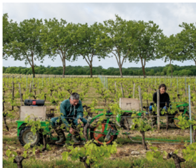
Château La Fleur des Aubiers (33)

Présents sur l'ensemble du territoire, les médecins du travail, les infirmiers en santé au travail et les conseillers en prévention des risques professionnels sont à l'écoute de vos problématiques de santé et de sécurité au travail, que vous soyez salarié agricole ou exploitant, employeur de main d'œuvre ou pas. Ces professionnels peuvent vous apporter des solutions adaptées et personnalisées dans le cadre de la santé sécurité au travail.